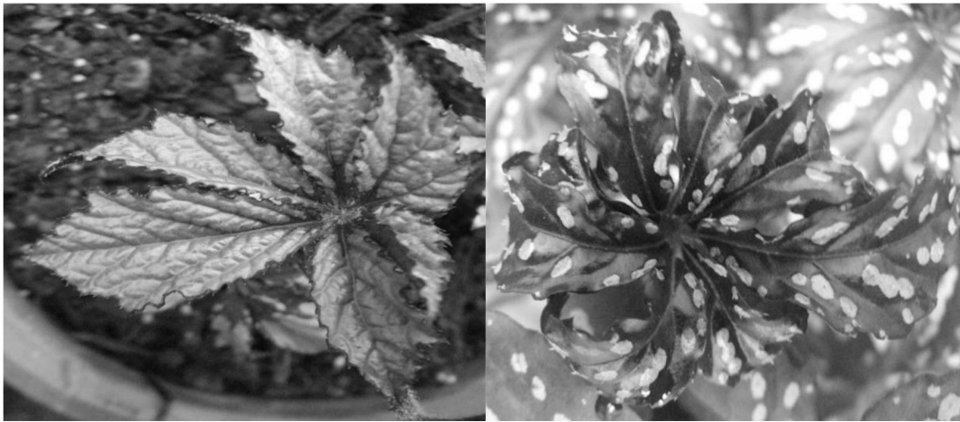
② 幼叶颜色 浅桃红色