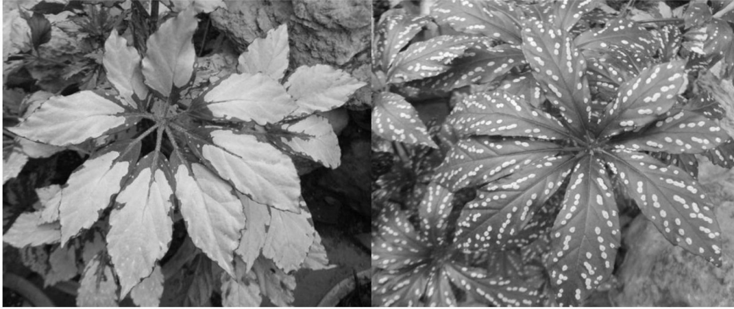
① 叶片斑纹 叶面银白色斑块