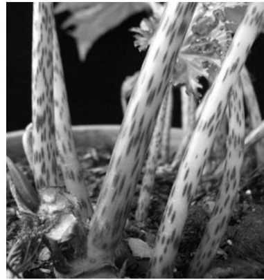
绿色，紫红色条纹明显