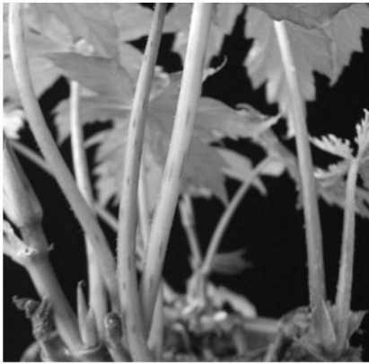
① 叶柄 褐绿色，紫红色条纹不明显