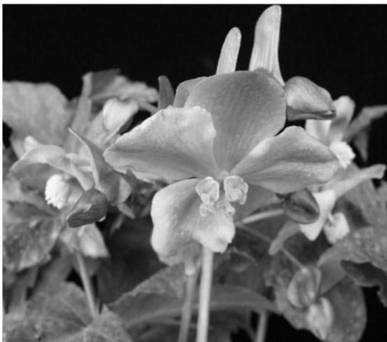
③ 花被片 深桃红色（RED PURPLE N66B）