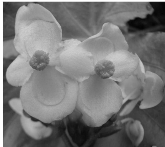
浅粉红色（RED PURPLE 62C）