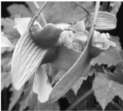
② 果实 具不等 3 翅