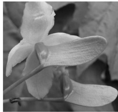
仅 1 翅